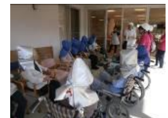
避難場所に集合し、中根荘長による訓練の講評がなされる