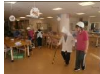
避難誘導される特養・デイサービスご利用者様