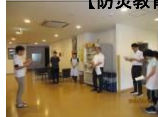
総合防災訓練の変更内容の周知及び防災設備の使用方法について確認