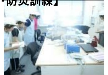
各所属分隊にそれぞれの措置行動等について指示、命令を行う隊長