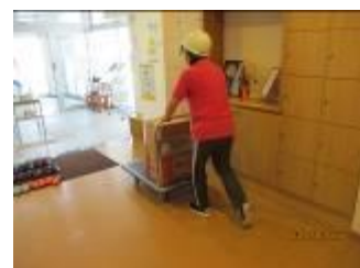
物資班長による物資搬出