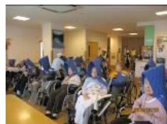
避難場所に集合している特養ご利用者様