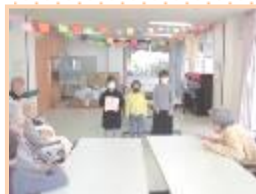
増穂南小3年生交流会